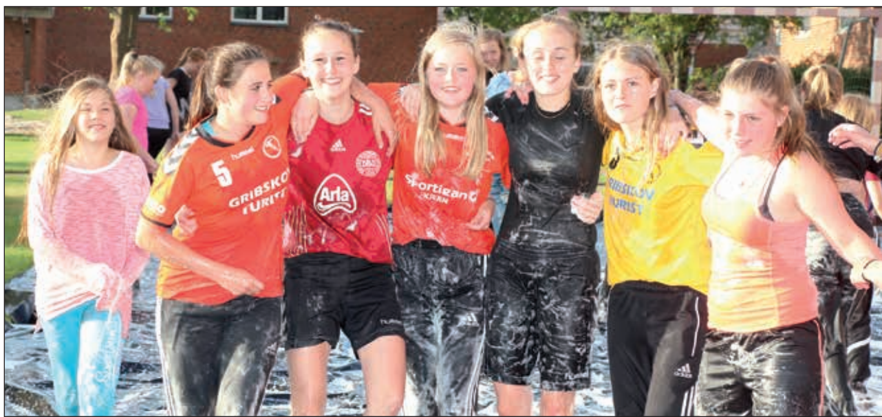
KK 2015, Løgumkloster Efterskole

Vi ønsker de 276 konfirmanden, som er tilmeldt dette års kursus, to "fede" uger på KK, dvs. to uger, hvor de møder Gud, sig selv og andre mennesker på et dybere plan, end de før har gjort! ✨