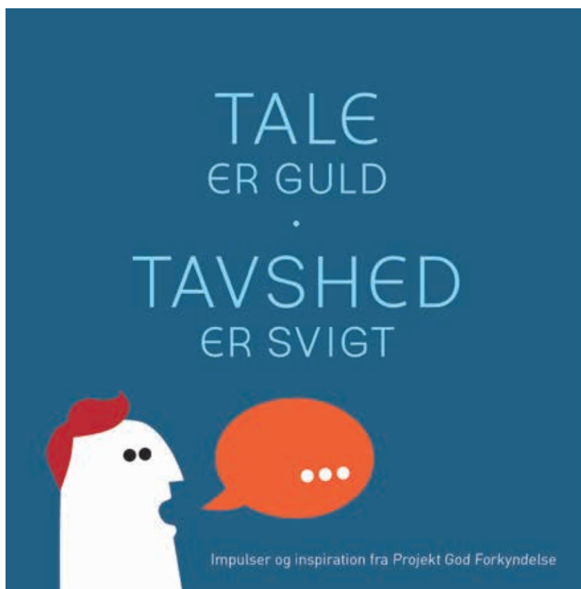
Pixibogen er oplagt at dele ud i din menighed eller missionshus.

Send en e-mail til chp@kpi.dk eller ring til 48 24 24 62 (indtal evt. telefonbesked). Oplys antal samt postadresse, så har du pixibøgerne, inkl. faktura i løbet af få dage. 🌱