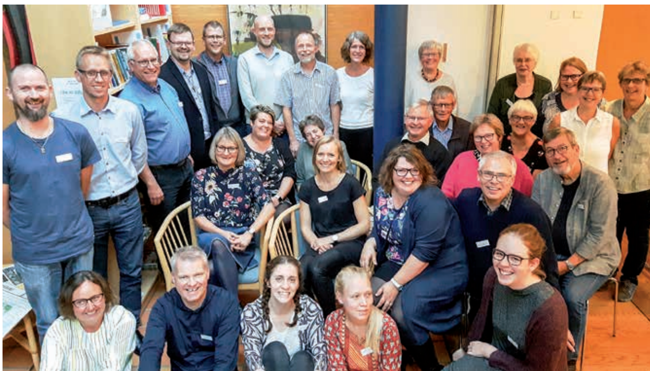
Her ses flokken, der var samlet til KPI's første generalforsamling

Efter en evaluering af dette års generalforsamling vil bestyrelsen i de kommende måneder fastlægge form og indhold for næste generalforsamling, der afvikles den 7. september 2018. 🌱