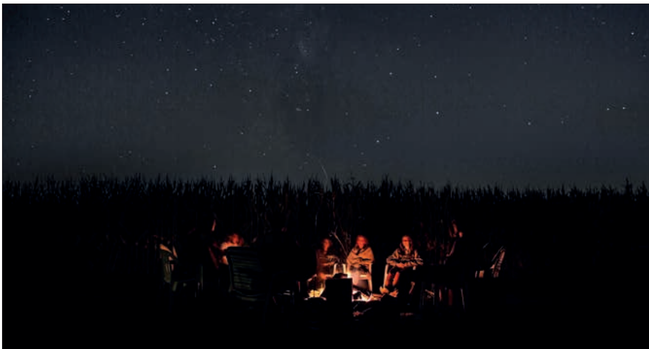
Mentor er altid i udkanten af lejrblået. Det er fra denne noget distancerede position, at det sande nærvær kan udspille sig og få betydning.

evnen til at gøre ting bedre i fremtiden. Man lærer af sine fejl. Dette er et kendt princip inden for både skibs- og luftfart. Ved at piloter og andre mennesker i ansvarsfulde stillinger fortæller sandt om næsten-ulykker og fejltrin, de selv har begået, vil man på sigt kunne lære sig at håndtere sådanne situationer bedre i fremtiden. "Det er ved at falde, man lærer at gå," hedder det.