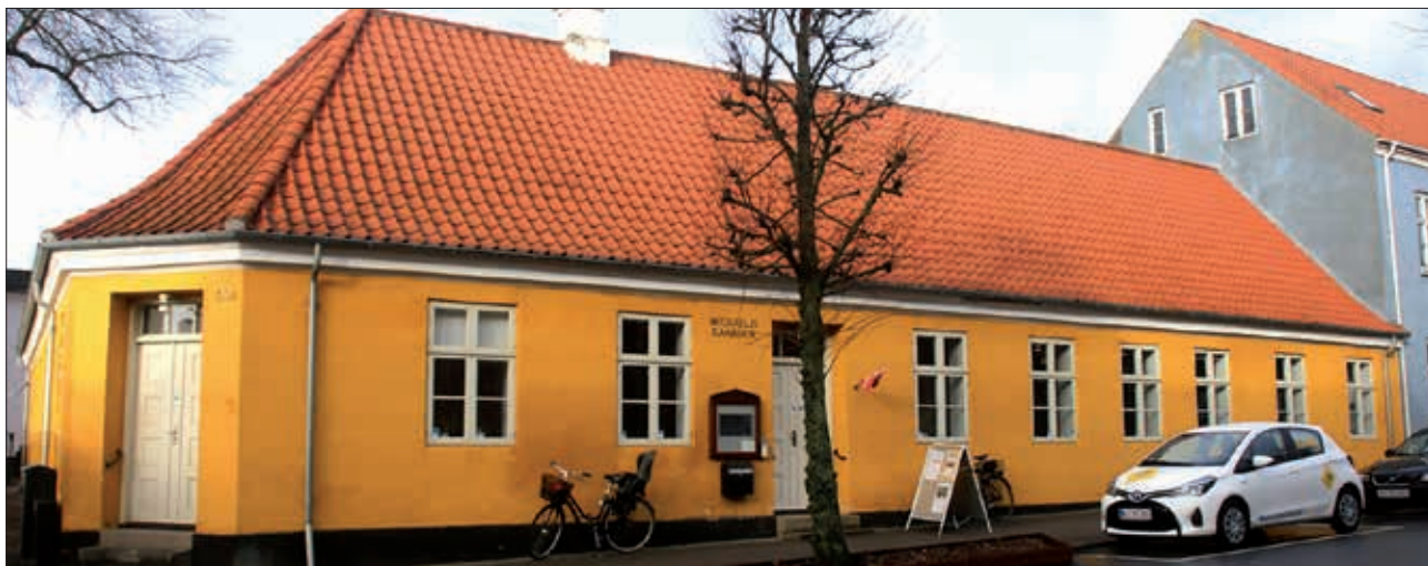
Michaelisgården i Fredericia.