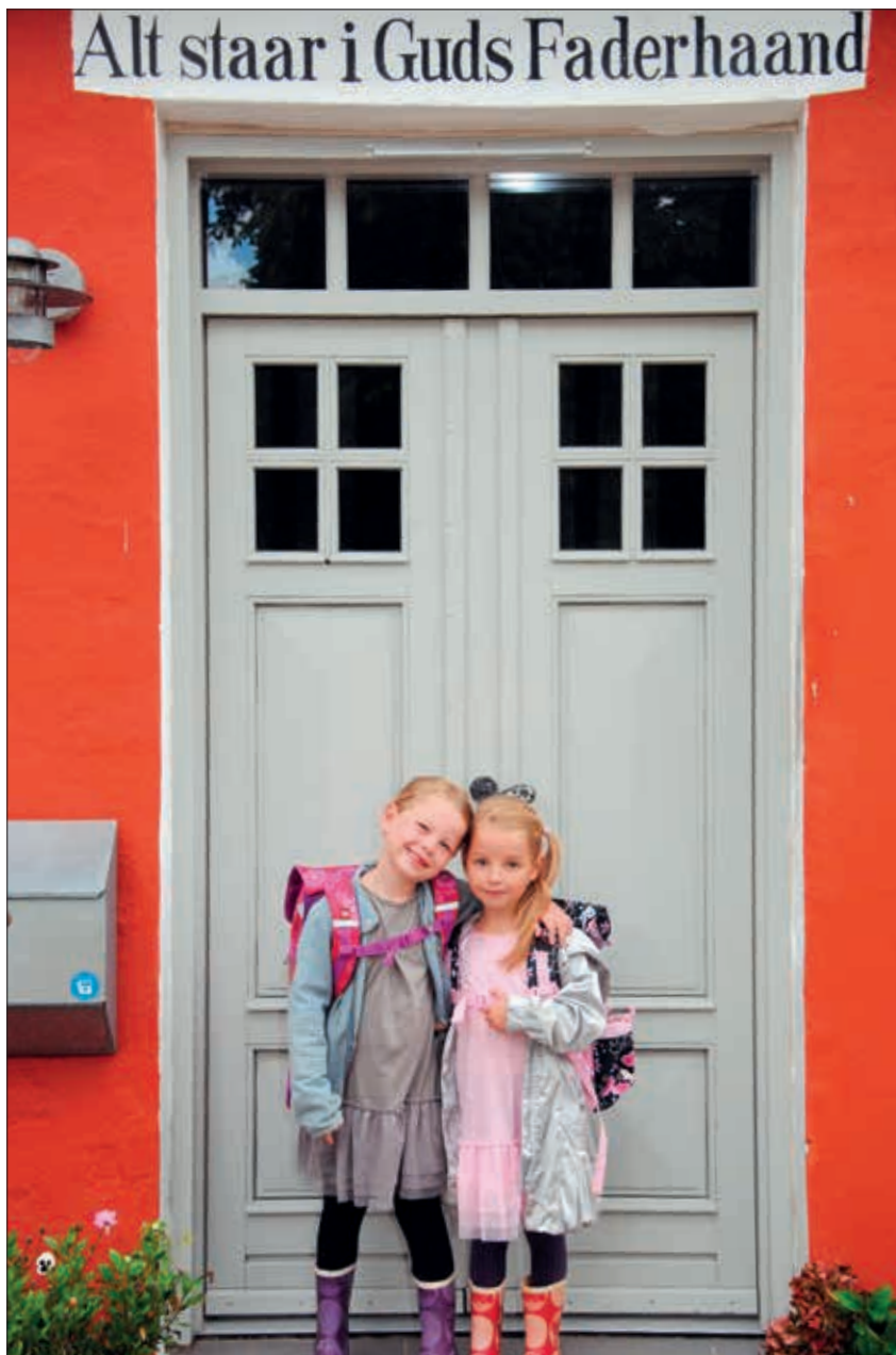
Det er ikke først og fremmest forælderen, der har barnets liv i sin hånd, men den almægtige Gud.

Denne artikel er blevet til på baggrund af Mathias R. Jepsen-Hansens opgave på første år på KPI Akademi.