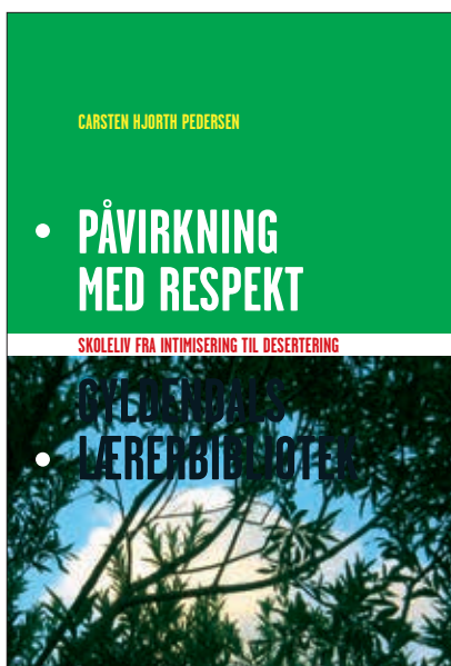
Påvirkning med respekt udkom på Gyldendal i 2007.