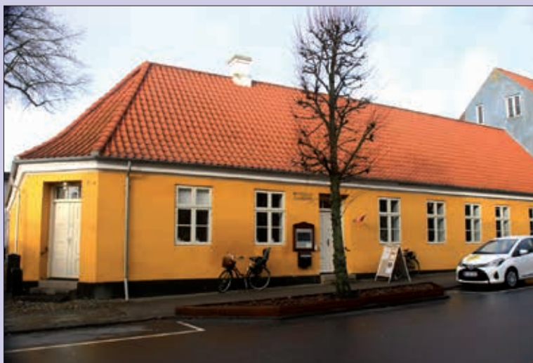
Michaelisgården i Fredericia.

I Michaelisgården, Vendersgade 30 B, 7000 Fredericia