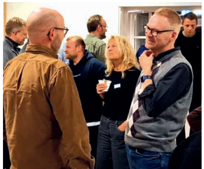
140 efterskole- og gymnasielærere var samlet til KPI's Efterskolekursus i november 2024.

Sæt kryds i kalenderen og tag ledergruppen fra