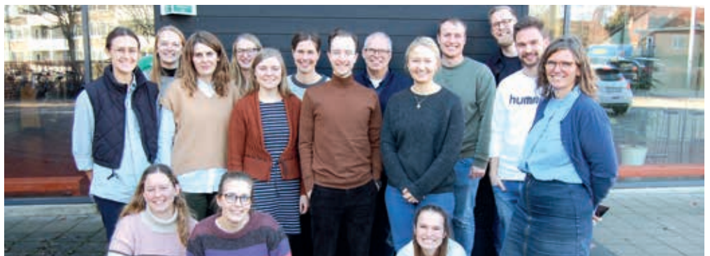
Det seneste hold på KPI Akademi ved deres opstart i januar 2022.

KPI Akademi giver ekstra udgifter for KPI, som vi vil bede om hjælp til at dække. Akademiforløbet er gratis for de studerende, som kun dækker egne udgifter til transport og bøger, og det er en vigtig prioritering for os, at forløbet skal være tilgængeligt netop for dem, der er et sted i livet, hvor økonomien ikke er så stærk. Derfor har vi brug for din hjælp til at kunne gennemføre KPI Akademi. Du kan støtte KPI Akademi ved at sende et beløb på MobilePay 955533 – bemærk evt. KPI Akademi. Skriv CPR nummer, hvis du vil have fradrag. Du kan også støtte via vores hjemmeside.